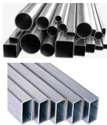
Трубы для столбов и поперечин