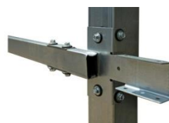
X-кронштейны для крепления поперечин