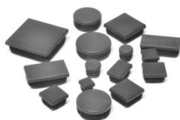
Заглушки на столбы и поперечины