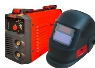
Сварочный аппарат для крепления поперечин к столбам