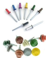
Заклепки и саморезы