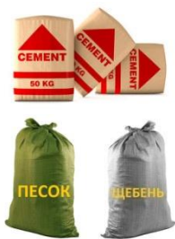
Цемент, щебень, песок для установки столбов