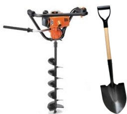
Ямобур или лопата