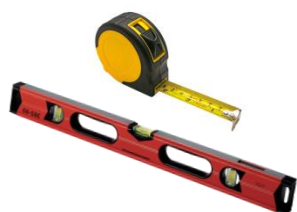
Рулетка, уровень и прочий вспомогательный инструмент